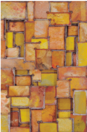
Left: Nathan Slate Joseph, Chichentime 1 , 2011, pure pigment on steel, 60 x 34 inches

展覽日期: 2013年6月21日 - 8月16日 開幕酒會: 6月21日, 下午6-8時, 星期五